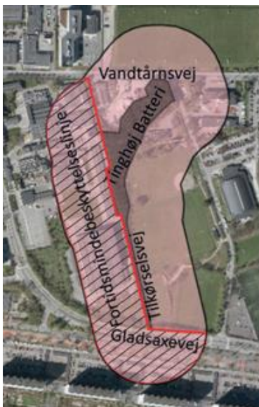
Figur 1. Tinghøj Batteri med tilkørselsvej er det grå felt (selve fortidsmindet). Omkring dette ses beskyttelseslinjen som et lyserødt felt. Dele af beskyttelseslinjen foreslås reduceret, hvilket ses af det skraverede felt.

I Mørkhøj Erhvervs kvarter ligger fortidsmindet Tinghøj Batteri. Rundt om dette findes en fortidsmindebeskyttelseslinje, der har været der siden 1962 (vist med lyserød på figur 1). I dette område er der en række forbud mod byggeri m.v. Igennem tiden har denne beskyttelse ikke været håndhævet konsekvent, så der i dag findes en række forhold på stedet, hvor der mangler en dispensation fra fortidsmindebeskyttelseslinjen. For at komme disse forhold til livs, foreslår By- og Miljøforvaltningen, at Gladsaxe Kommune søger om at få denne linje reduceret, så de nuværende forhold bringes i orden og den fremtidige brug af arealerne smidiggøres med respekt for fortidsmindet.