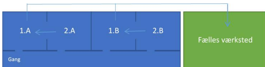
Figur 3 Klasselokaler i kombination med værksteder

Alternativt kan der arbejdes med at skabe større fællesområder til projektområder og værkstedsfaciliteter, som kan danne ramme om mere varierede læringsaktiviteter og forløb med flere klasser. Dette kan kombineres med klasselokaler, der er indrettet med inventar, som kan skabe varierede arbejdspladser i klasselokaler og giver eleverne mulighed for flere forskellige arbejdsstillinger og gruppedannelser i varierende størrelse i den enkelte klasse. Det har bl.a. praksisforsøget på Vadgård Skole gode erfaringer med.