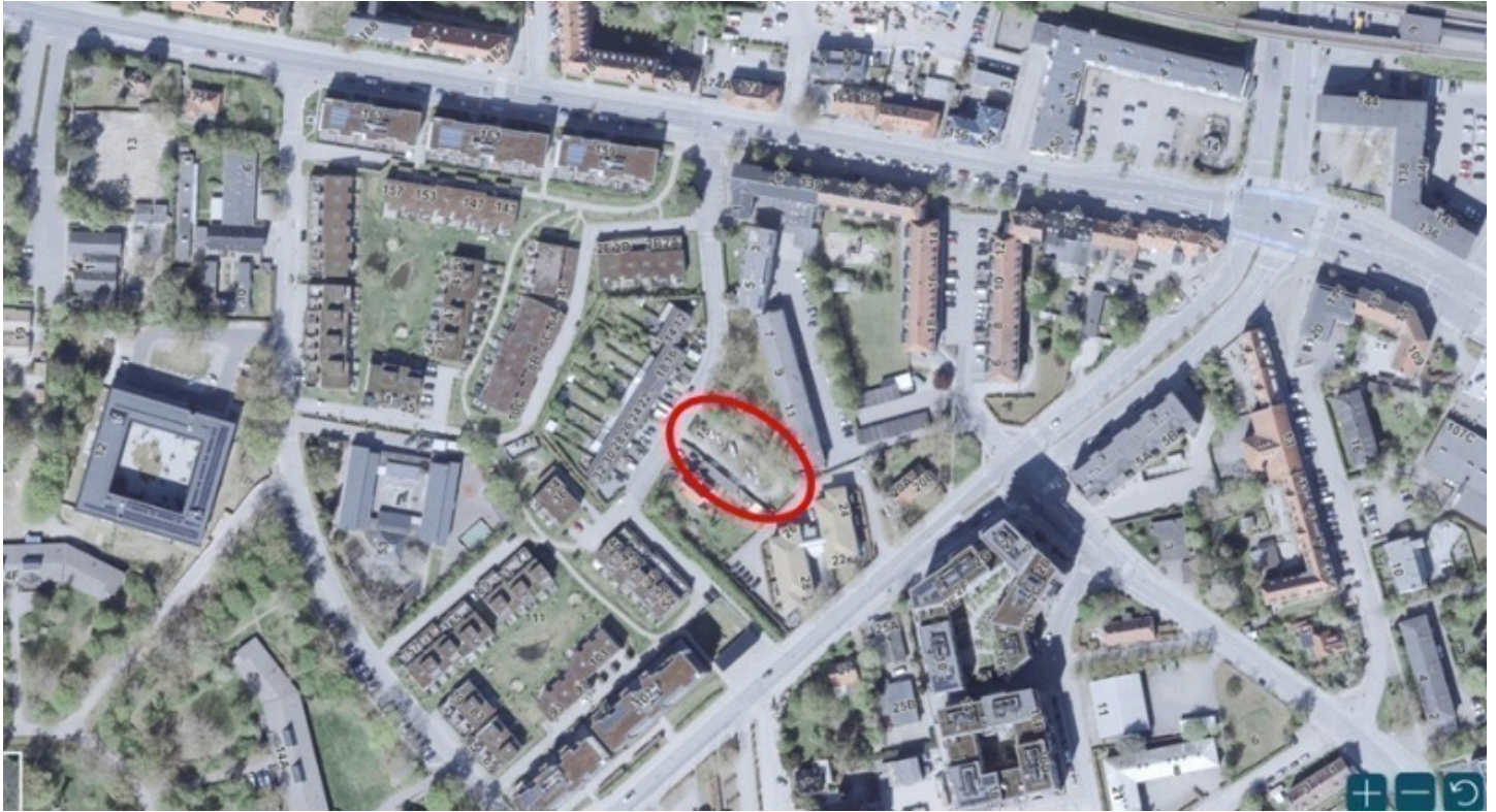
Kortudsnit med markering af parkeringspladsen på Pinievej 15.

By- og Miljøforvaltningen bemærker, at grunden er beliggende i et område, der i den gældende Kommuneplan er udlagt til centerområde. Grunden er endvidere omfattet af lokalplan 55, delområde 2, hvor anvendelsen er fastlagt til centerformål som administration, liberale erhverv og boliger. Lokalplanen er vedtaget i 1989, og der er ikke noget i lokalplanen, der tilsiger, at grunden skal anvendes til parkering. Det er dog forvaltningens opfattelse, at arealet dækker et nuværende parkeringsbehov i området.